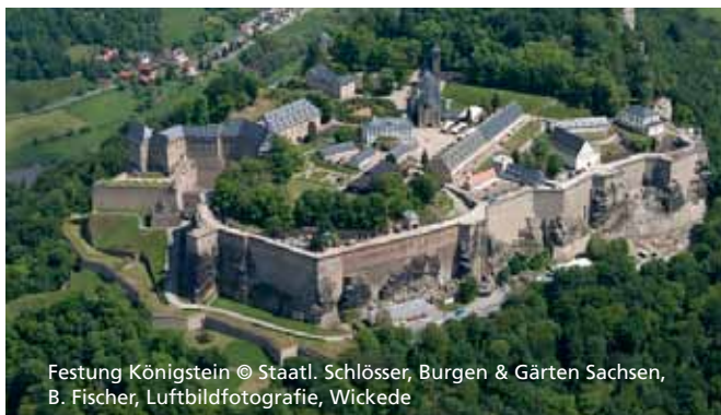
Festung Königstein