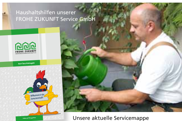
Unsere aktuelle Servicemappe