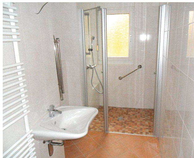
begehbbare bodengleiche Dusche mit Glaswand