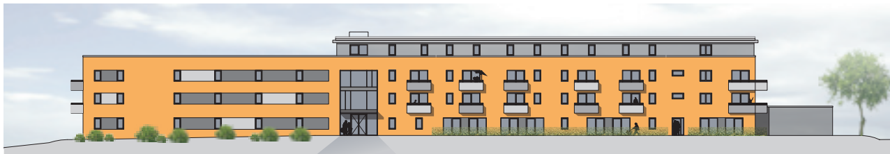
Nordost / Blücherstraße