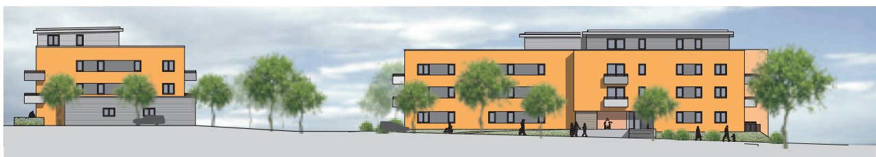
Nordwest / Yorckstraße

Das „Servicewohnen“ – eine Wohnform, die insbesondere älteren Menschen die Möglichkeit gibt, in ihren eigenen vier Wänden zu wohnen und die Vorzüge der Betreuung nach individuellem Bedarf in Anspruch zu nehmen - erweitert das Portfolio der Wohnungsgenossenschaft um dringend benötigten seniorengerechten Wohnraum. Es gibt in 3-geschossigen Gebäuden mit Staffelgeschoss insgesamt 71 barrierearme bzw. barrierefreie Zwei- und Drei-Raum-Wohnungen (davon 8 rollstuhlgerecht) alle mit Balkon oder Terrasse bzw. Dachterrasse, die über einen Aufzug erschlossen werden.