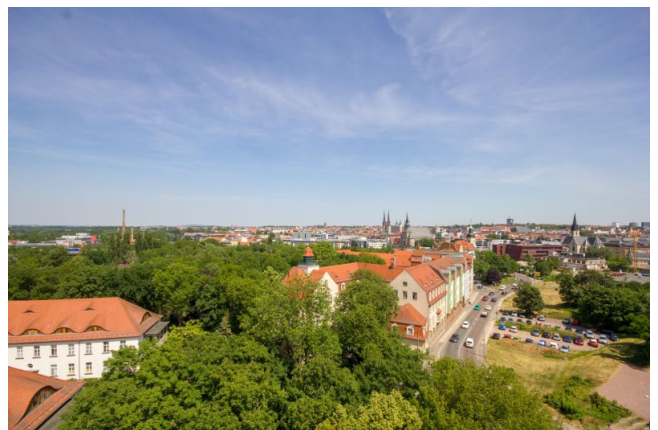
Bsp: Aussicht Balkon