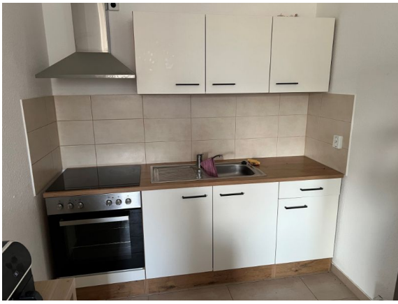
Einbauküche von PRIVAT