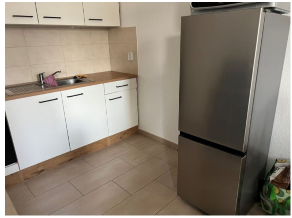
Einbauküche von PRIVAT