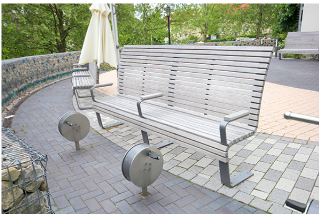
für sportliche Aktivitäten