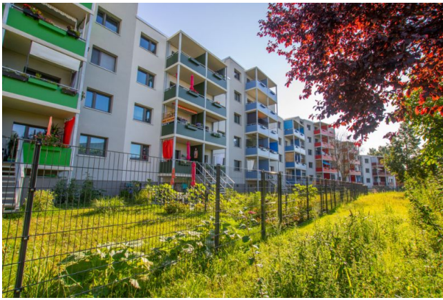
Ansicht hinten, Mietergärten