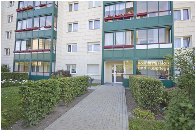
Eingangsbereich Straße barrierefrei