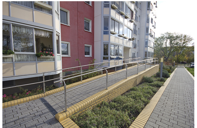
Rampe Eingang hinten