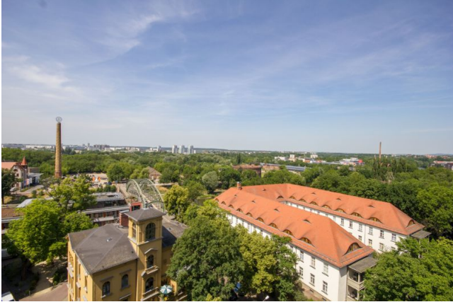
Bsp: Aussicht Balkon