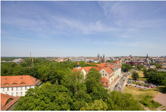
Bsp: Aussicht Balkon