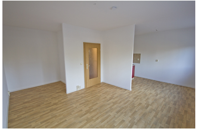
Wohn / Schlafbereich