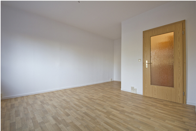
Wohn / Schlafbereich